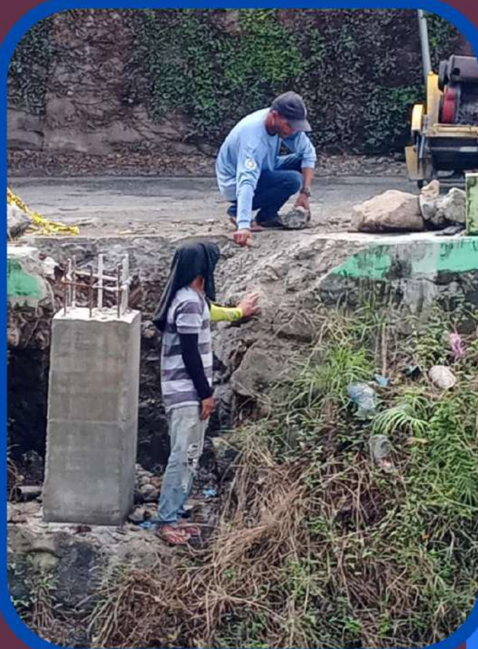
Tabang Bridge - Relocation of Steel Pipe