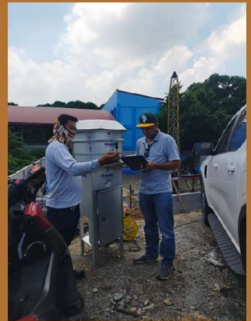
Air and Noise sampling for the Construction of Ground Reservoir at Brgy. Banga 1st